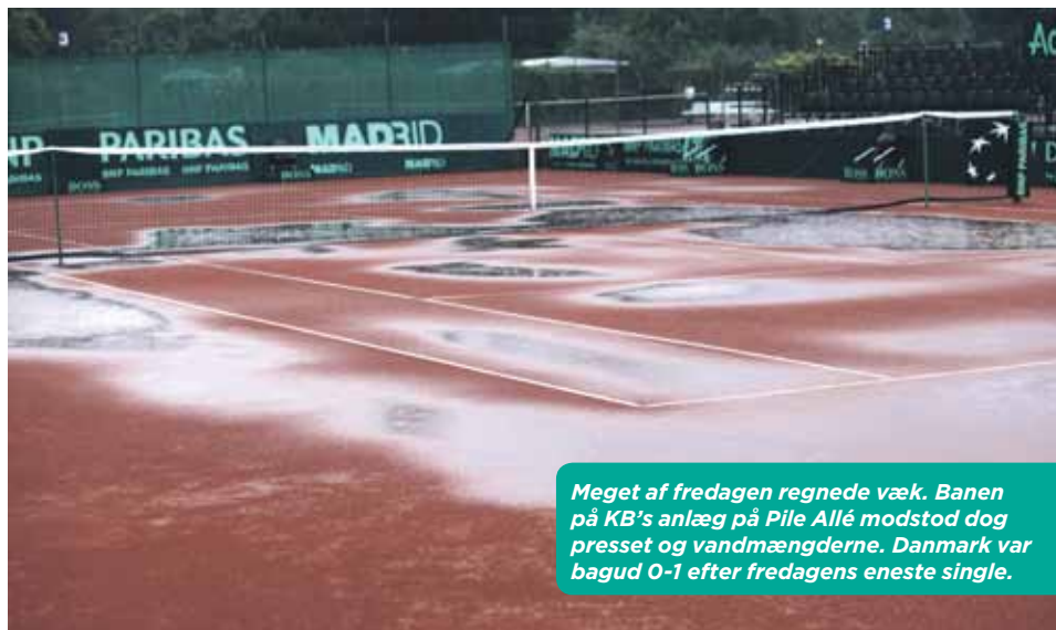
Meget af fredagen regnede væk. Banen på KB's anlæg på Pile Allé modstod dog presset og vandmængderne. Danmark var bagud 0-1 efter fredagens eneste single.